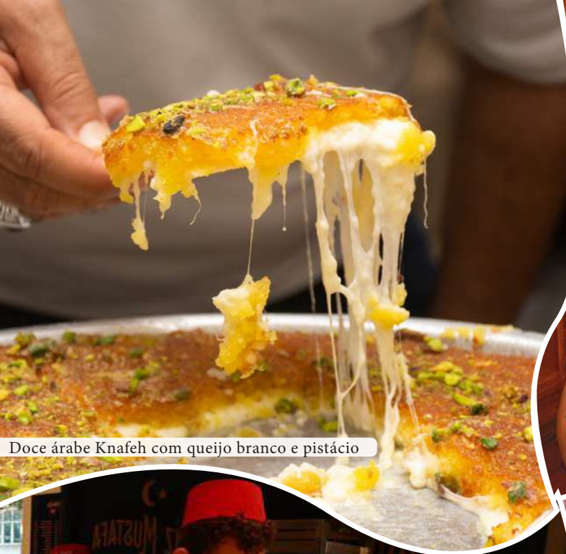
Doce árabe Knafeh com queijo branco e pistácio