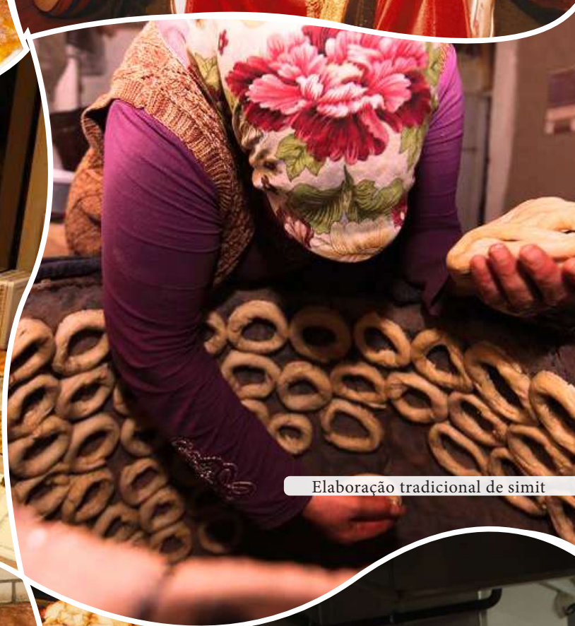
Elaboração tradicional de simit