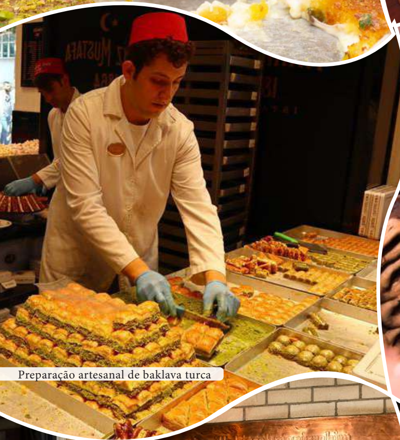
Preparação artesanal de baklava turca