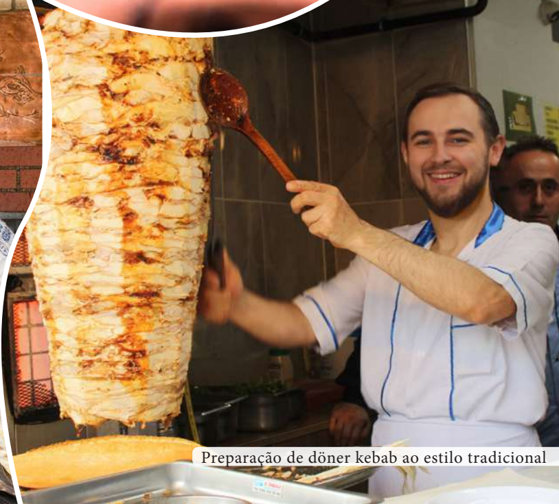
Preparação de döner kebab ao estilo tradicional