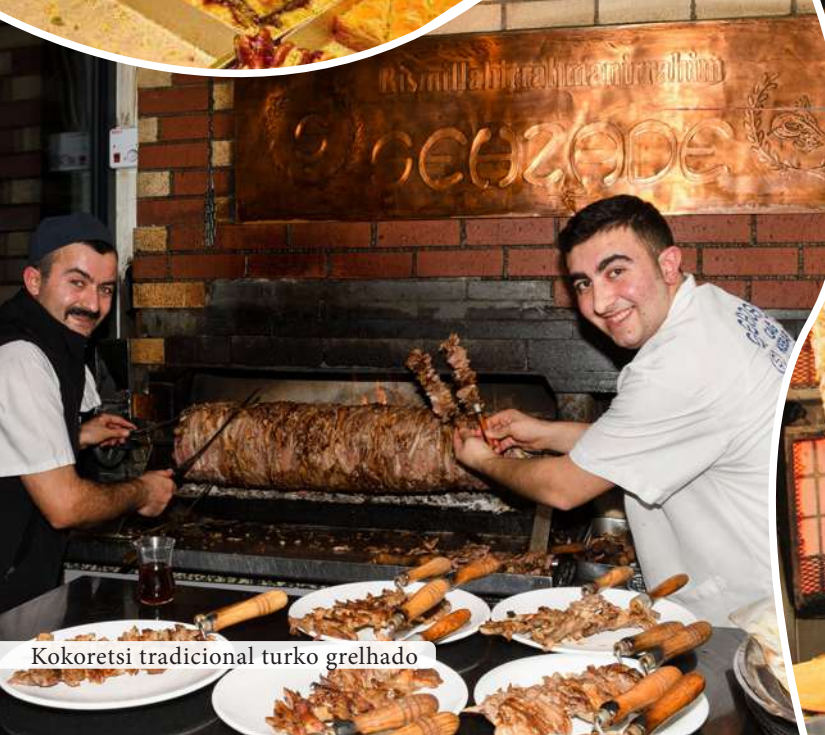
Kokoretsi tradicional turco grelhado