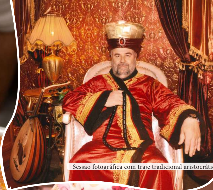
Sessão fotográfica com traje tradicional aristocrático